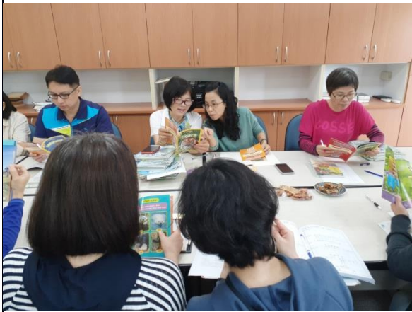
第三次課程研討-生態英語專書選讀