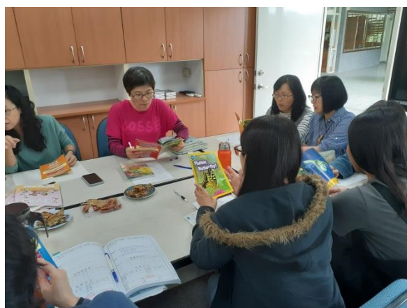
第三次課程研討-生態英語專書選讀